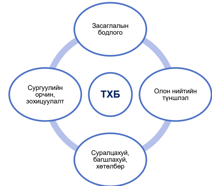
Зураг 1. Сургууль бүхлээрээ ажиллах арга хандлага

Сурагчдад сурсан зүйлээ хэрэглэн амьдрах, амьдарч буй орчноосоо суралцах боломж олгохын тулд сургалтын байгууллага СБААХ-аар дамжуулан сургалтын орчныг хувирган өөрчлөх