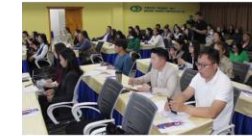
Залуучуудын байгууллагын төлөөлөл