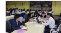
Иргэний нийгмийн байгууллагын төлөөлөл