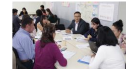
Аж ахуйн нэгж, бизнес эрхлэгчдийн төлөөлөл