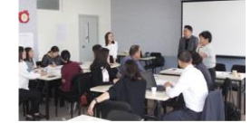
Хэвлэл мэдээллийн байгууллагын төлөөлөл