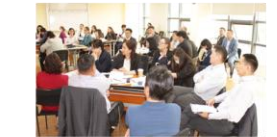
Төрийн байгууллагын төлөөлөл