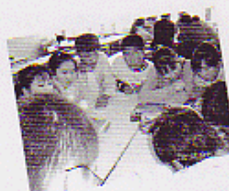
Хэрлэн сумын XI сургуулийн эгдөөд орчны цэцэгжүүлэлт