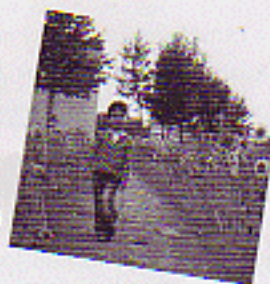
Матад, Хэрлэн сумын V сургуулийн экологийн клубын гишүүд