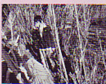
"Янзага" төслид хамрагдсан сургагчдын байгаль орчинтой танилцах "Үүрэгчтэй аялал" сургалт.

Дорнод аймгийн Байгаль орчны албанаас хэрэгжүүлсэн "Янзага" төслийн хүрээнд аймгийн ЕБС-иудын Байгаль экологийн клубуудын үйл ажиллагааг дэмжиж, доорх ажлуудыг хийлээ.