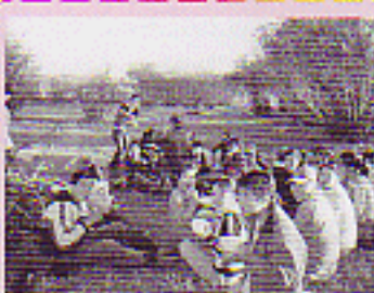
Хэрлэн сумын ЕБС-иудын байгаль экологийн клубуудын нээгдсэн цугларалт "Байгаль дахь хичээл"-ийг Хэрлэн голын эрэгт зохион байгуулсан нь.