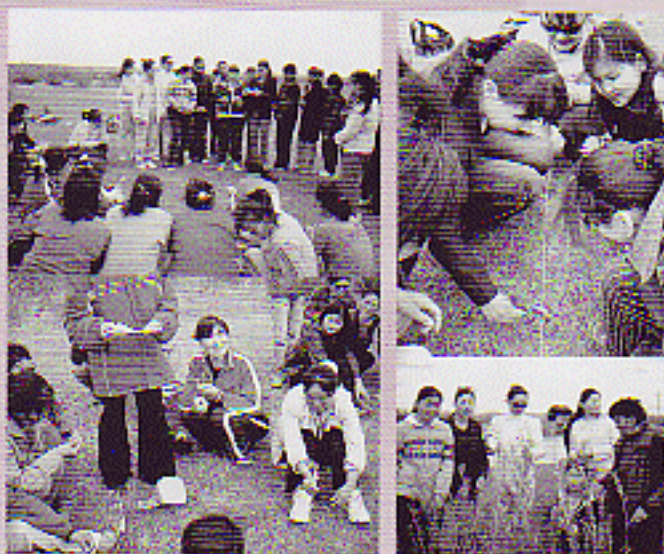
Байгаль дахь сургалтанд оролцсон байгаль, нийгмийн ухааны болон цэцэрлэгийн багш нар