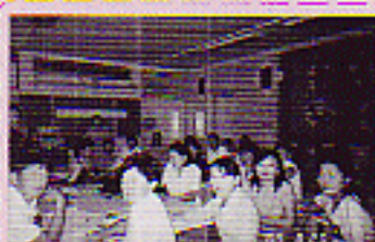
Хэрлэн сумын V сургуульд зохион байгуулсан сургалт

"Ургамалжилт-агаарын бохирдол" сэдвээр Шинэ хөгжил, VI сургуульд, "Орчны бохирдолт хог хаягдал" сэдвээр Хэрлэн сумын V сургуульд, "Дэлхийн цаг агаарын өөрчлөлт" Хэрлэн сумын II сургуульд, "Хөрсний бохирдол" сэдвээр VI, "Тогтвортой хөгжил-ногоон сургууль" сэдвээр XII сургуульд сургалт зохион байгууллаа. "Байгаль дахь хичээлийг бага насны хүүхдэд зохион байгуулах нь" сэдвээр Хэрлэн сумын 8 цэцэрлэгийн багш нарт зохион байгууллаа.