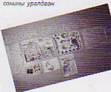
"Байгаль ба хүүхэд" сэдвээр ханын сонин уралдаан