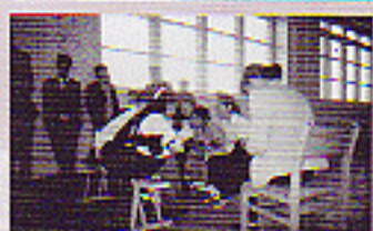
"Орчны бохирдол, хог хаягдал" сэдэвт тэмцээн