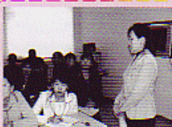
Хэрлэн сумын XII сургууль "Тогтвортой хөгжил-ногоон сургууль" сэдвээр сургалт