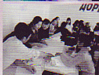
"Интеграцчилсан сургалтын хөтөлбөр боловсруулах арга зүй" сэдэвт сургалтанд оролцсон багш нар